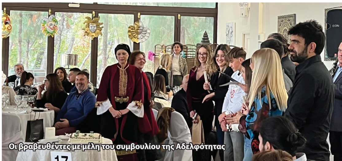
Οι βραβευθέντες με μέλη του συμβουλίου της Αδελφότητας