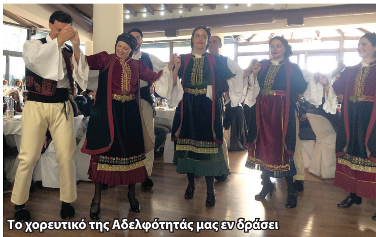
Το χορευτικό της Αδελφότητάς μας εν δράσει

Στη συνέχεια, τον χορό ξεκίνησαν οι επίσημοι καλεσμένοι μας