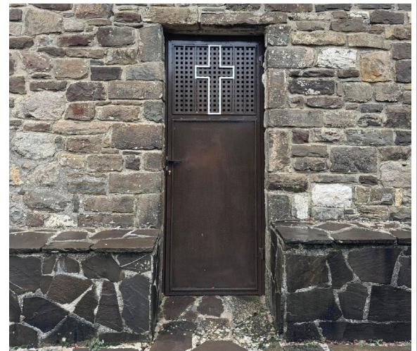
Η καινούρια πόρτα στο Οστεοφυλάκιο του χωριού μας.