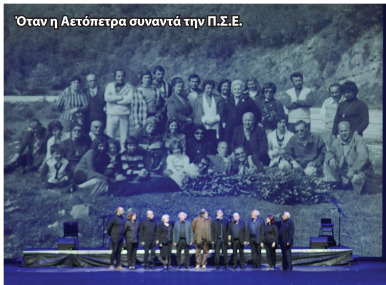
Όταν η Αετόπετρα συναντά την Π.Σ.Ε.