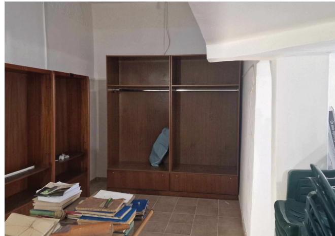
Εργασίες στο ακίνητο

Το αποτέλεσμα που προέκυψε μας αποζημίωσε. Δημιουργήθηκε ένα σύγχρονο διαμέρισμα που μας κάνει να πιστεύουμε ότι θα πολλαπλασιάσει τα έσοδα της Αδελφότητάς μας. Στην πορεία αυτών των έργων διαπιστώσαμε φθορές στο κτίριο και συγκεκριμένα παρατηρήσαμε εισροή υδάτων στην γειτνίαση με τα διπλανά κτίρια, οπότε επισκευάσαμε τη ζημιά και μονώσαμε τα σημεία ένωσης των κτιρίων. Το κτίριο δημιουργεί ανάγκες για συντηρήσεις γιατί μετά την προσθήκη των ορόφων δεν έχει λάβει χώρα καμία επισκευή ή συντήρηση.