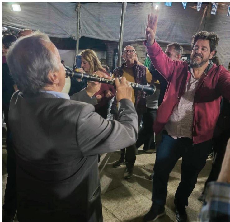
Στιγμιότυπο από το γλέντι μας.

Με τον καλύτερο τρόπο έκλεισε ο Οκτώβρης για όλους εμάς τους Αετοπετρίτες και φίλους. Με τον καλύτερο τρόπο άνοιξε φθινοπωρινά και χειμωνιάτικα η