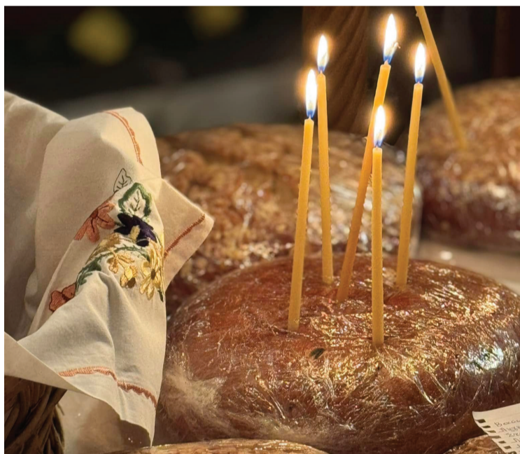
Από την Αρτοκλασία στον Αη Δημήτρη

Αυτόν ακριβώς τον σκοπό υπηρετούν και οι ευκαιρίες που βρίσκουμε για να ανταμώνουμε και να γιορτάζουμε όλοι μαζί. Ευχόμαστε από καρδιάς να περάσουμε όμορφα και φέτος και να γυρίσουμε πάλι στις δραστηριότητές μας γεμάτοι από όμορφες εικόνες και στιγμές του χωριού μας.