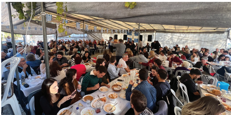
Κατάμεστη από κόσμο η αυλή του Σχολείου

ΟΧΙ της πατρίδας μας στις Δυνάμεις του Άξονα θα μας θυμίζει πάντα ότι η ελευθερία και η δημοκρατία κερδίζονται αν όχι με διάλογο, τότε με αγώνες, θυσίες και μάχες. Φόρο τιμής με δάφνινο στεφάνι αποδίδεται από τον Πρόεδρο της Αδελφότητας, όπως συνηθίζεται κάθε χρόνο, στον ήρωα έφεδρο αξιωματικό, Θεοχάρη Μηλιώνη, που έπεσε μαχόμενος στα χαρακώματα των συνόρων μας, ενώ