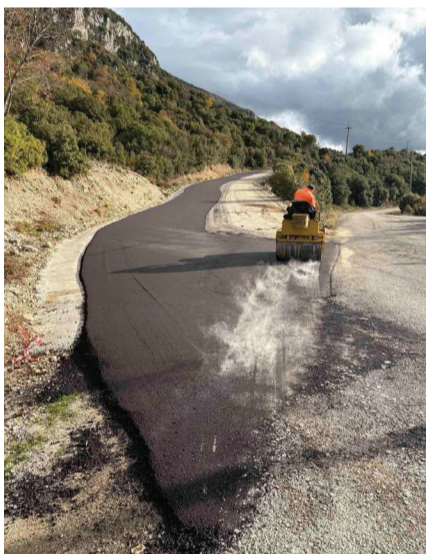
Έργα ασφαλτόστρωσης στην παράκαμψη της Βίγλας

πρωτοβουλία ανέλαβε - πέρα από κάθε υποχρέωση - και την αποκατάσταση του σημείου της κατεστραμμένης ασφάλτου στον Καμποπούλη, μπροστά από την καρυδιά, δείγμα της ευαισθησίας του για τις ανάγκες της κοινότητάς μας.