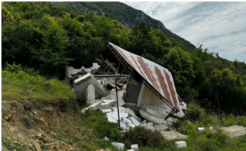
Η γκρεμισμένη εκκλησιά της Παναγίας στη Βίγλα

Με την ευκαιρία της προσέλευσης πολλών χωριανών για το καθιερωμένο πανηγύρι μας της Αγίας Παρασκευής, σας θυμίζουμε ότι η αποκομιδή των απορριμμάτων γίνεται κάθε Τρίτη, ενώ ειδικά για τις ημέρες του πανηγυριού θα υπάρξει μία ακόμη έκτακτη αποκομιδή.