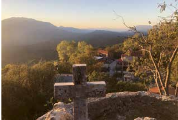
Ηλιόλουστος ο καιρός στο πανηγύρι του Αη δημητρη