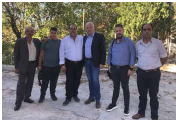
Αναμνηστική φωτο του Δημάρχου Ζίτσας και των μουσικών του πανηγυριού μας