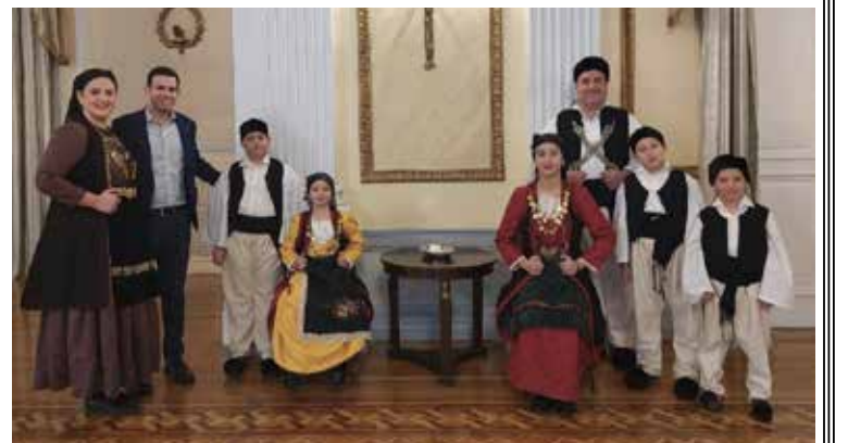
Ο Σύλλογος Ηπειρωτών Αγ. Βαρβάρας «ΑΠΕΙΡΩΤΑΝ» με Αετοπειρίτες στην Πρόεδρο της Δημοκρατίας

Συγχαρητήρια για την άψογη εκπροσώπηση της Αετόπετρας ενώπιον της Ανώτατης Αρχής της Πατρίδας μας.