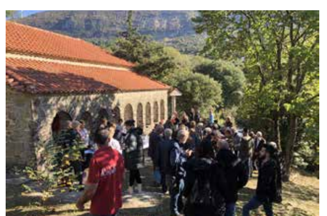
Λειτουργία στον Αη Δημήτρη, προαύλιος χώρος