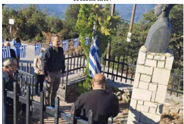
Κατάθεση στεφάνου στην προτομή του Θεοχάρη