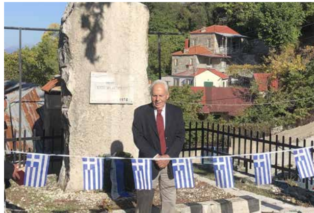
Κατάθεση στεφάνου από τον Τ.Π. στο μνημείο πεσόντων στον Αετό