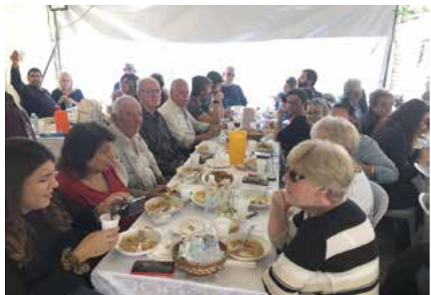
Οικογένεια Μηλιωναίων, Μπουρατζαίων και Παπαδαίων