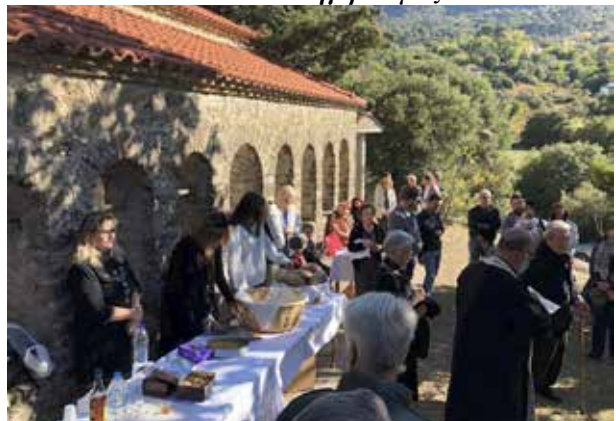
Κεράσματα στον Αη Δημήτριο