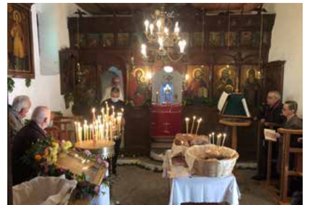
Λειτουργία στον Αη Δημήτρη