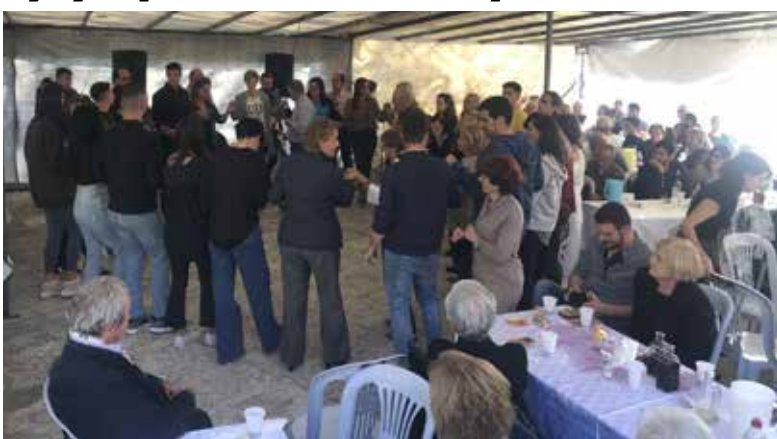
Το μεσημεριανό μας πανηγύρι του Αη Δημητρίου

Εντυπωσιακή ήταν η προσέλευση κοντοχωριανών μας από το Δεσποτικό (περίπου 30 άτομα μετά του Προέδρου της Αδελφότητάς της) αλλά