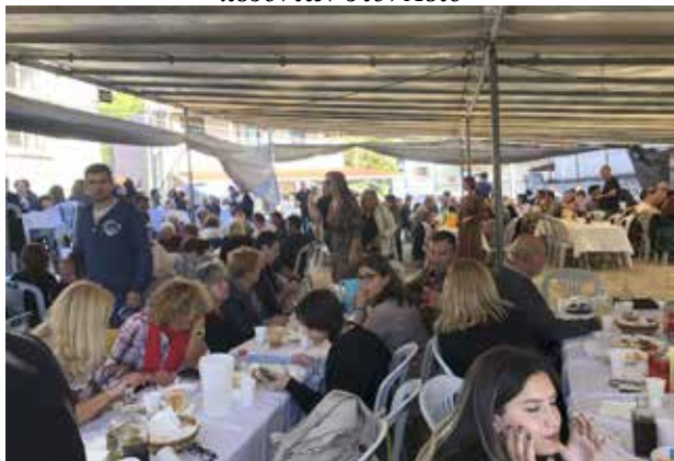
Το μεσημεριανό μας πανηγύρι του Αη Δημητρίου