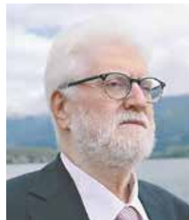
Ο εκλιπών Δήμαρχος Ιωαννίνων Μωσής Ελισάφ

«Σήμερα η πόλη μας έχασε έναν σπουδαίο άνθρωπο. Έφυγε από τη ζωή ο Δήμαρχος Ιωαννίνων. Μοναδικός, με κύρος και ισχυρή προσωπικότητα. Με όραμα για εξέλιξη, ανάπτυξη και με αναμφισβήτητη ικανότητα να καταφέρει όλα. Πολυπράγμων άνθρωπος του πνεύματος, της τέχνης, της επιστήμης και των γραμμάτων. Με πολλές επιτυχίες σε όλους τους τομείς στους οποίους ηγήθηκε.