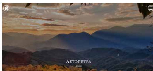
Τριήμερο Πανηγύρι Αγίας Παρασκευής